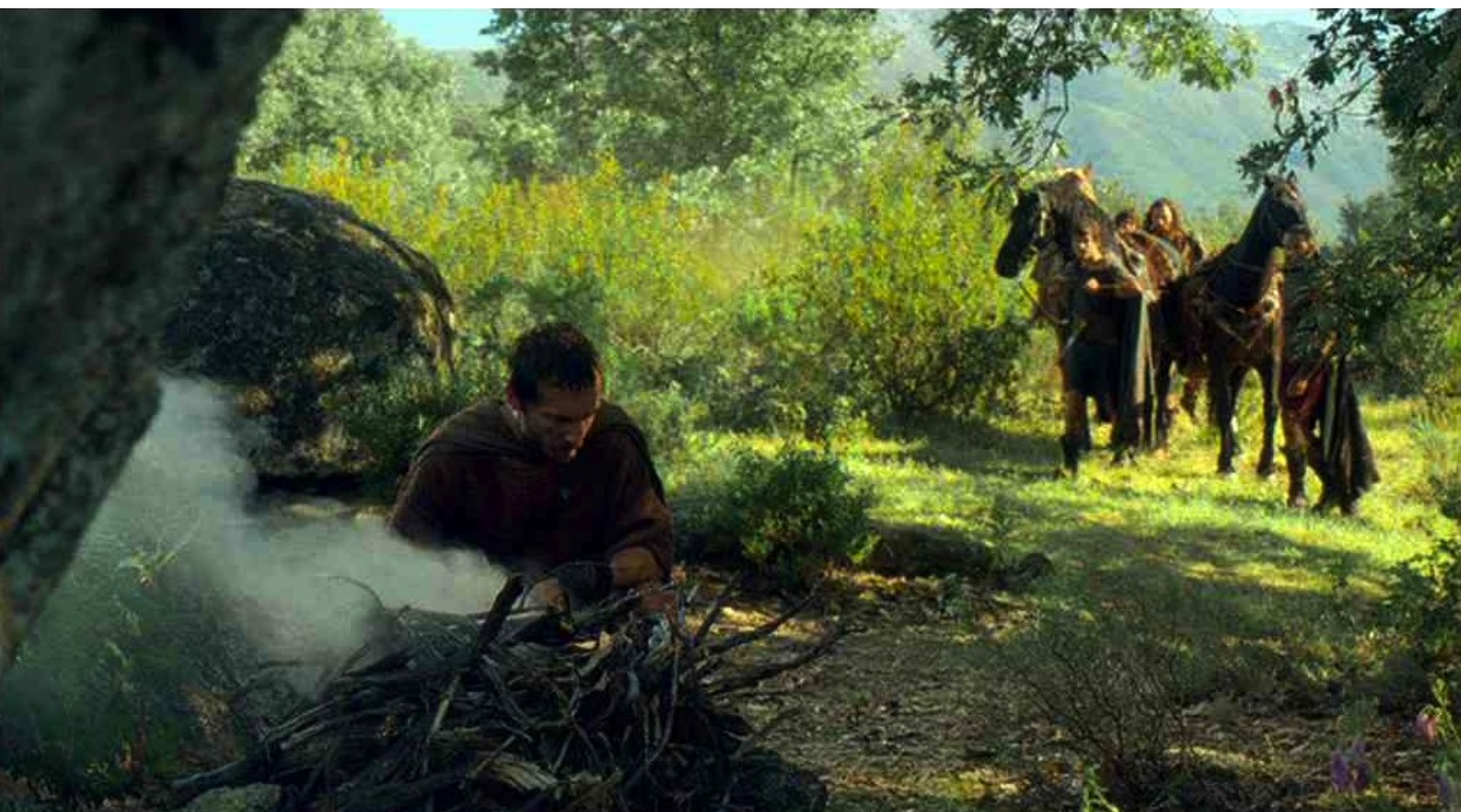
Hispania, la Leyenda : De son côté, Hector continue à jouer un double jeu : par de la fumée,