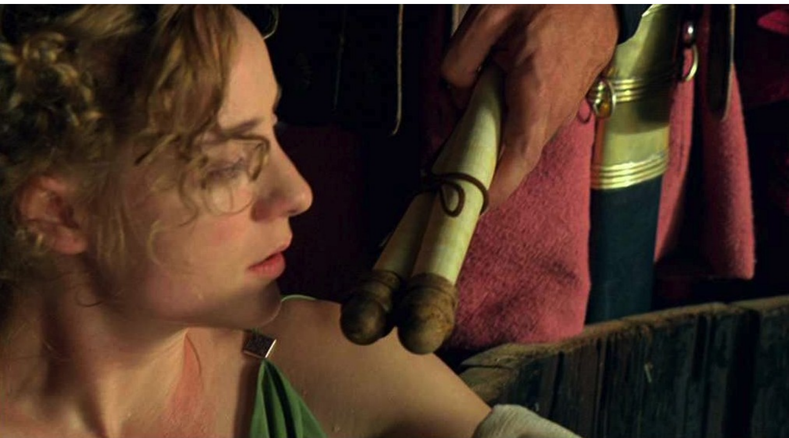
Hispania, la Leyenda : et lui donne son attestation d'affranchissement,