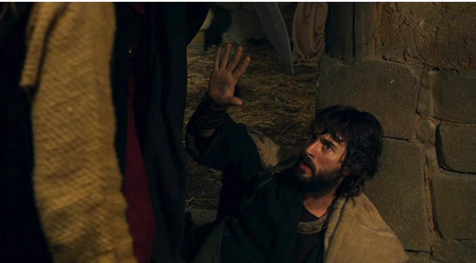
Hispania, la Leyenda : obligé de s'excuser et de demander pitié.