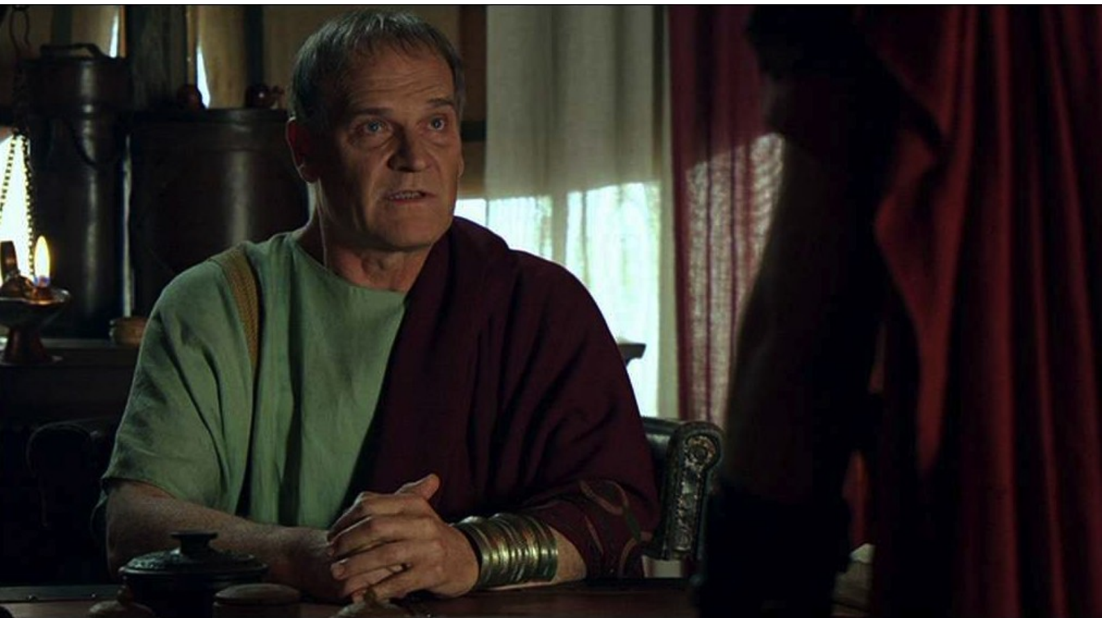
Hispania, la Leyenda : Mais Galba regrette qu'on n'ait pas tué tous les habitants...