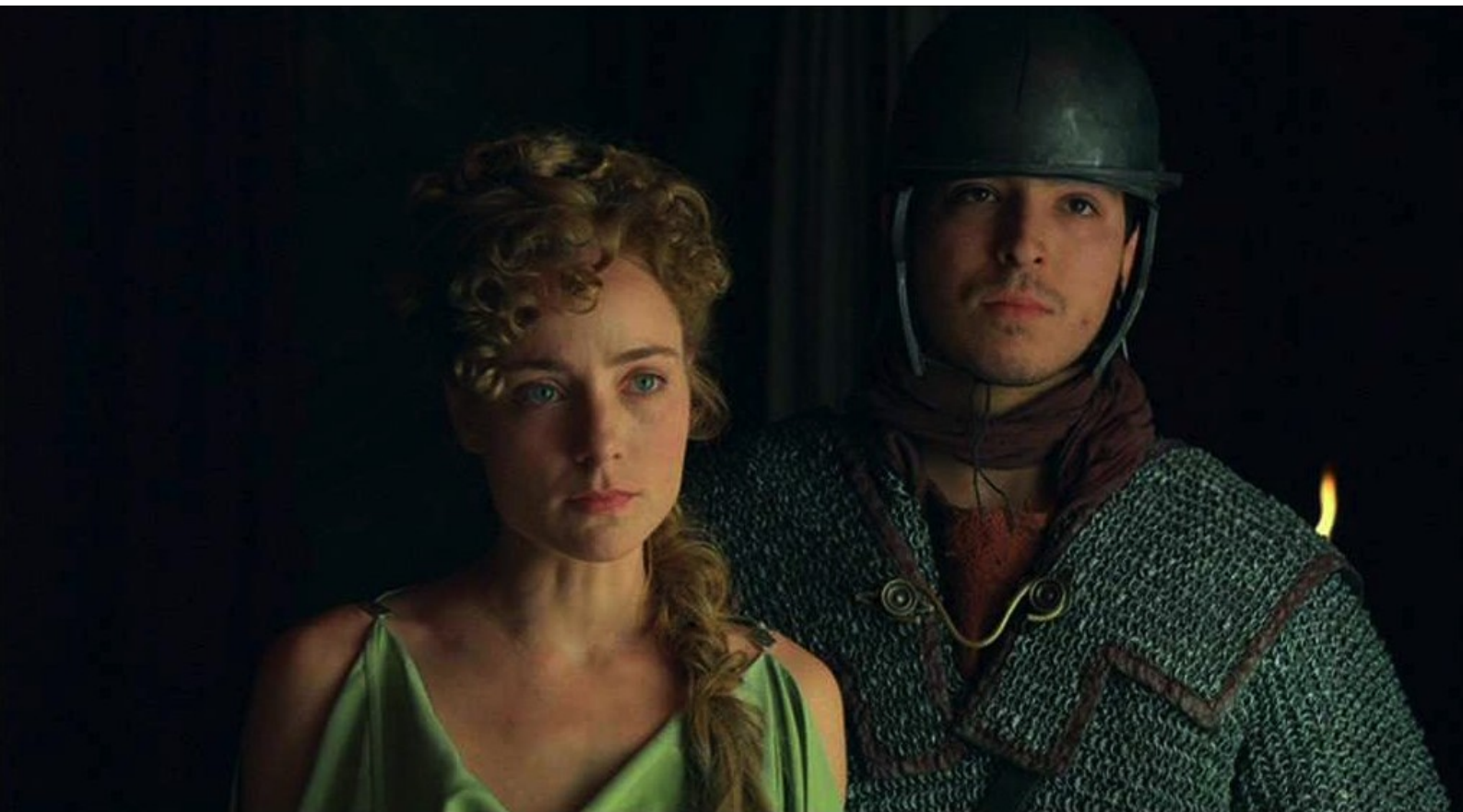
Hispania, la Leyenda : se fait amener Sabina, la viole...