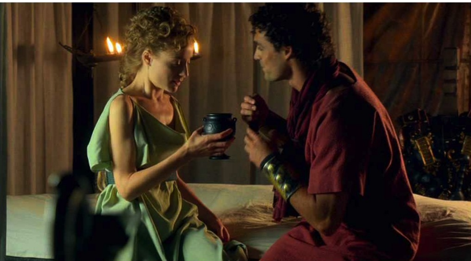
Hispania, la Leyenda : Ensuite les amants boivent le vin empoisonné,