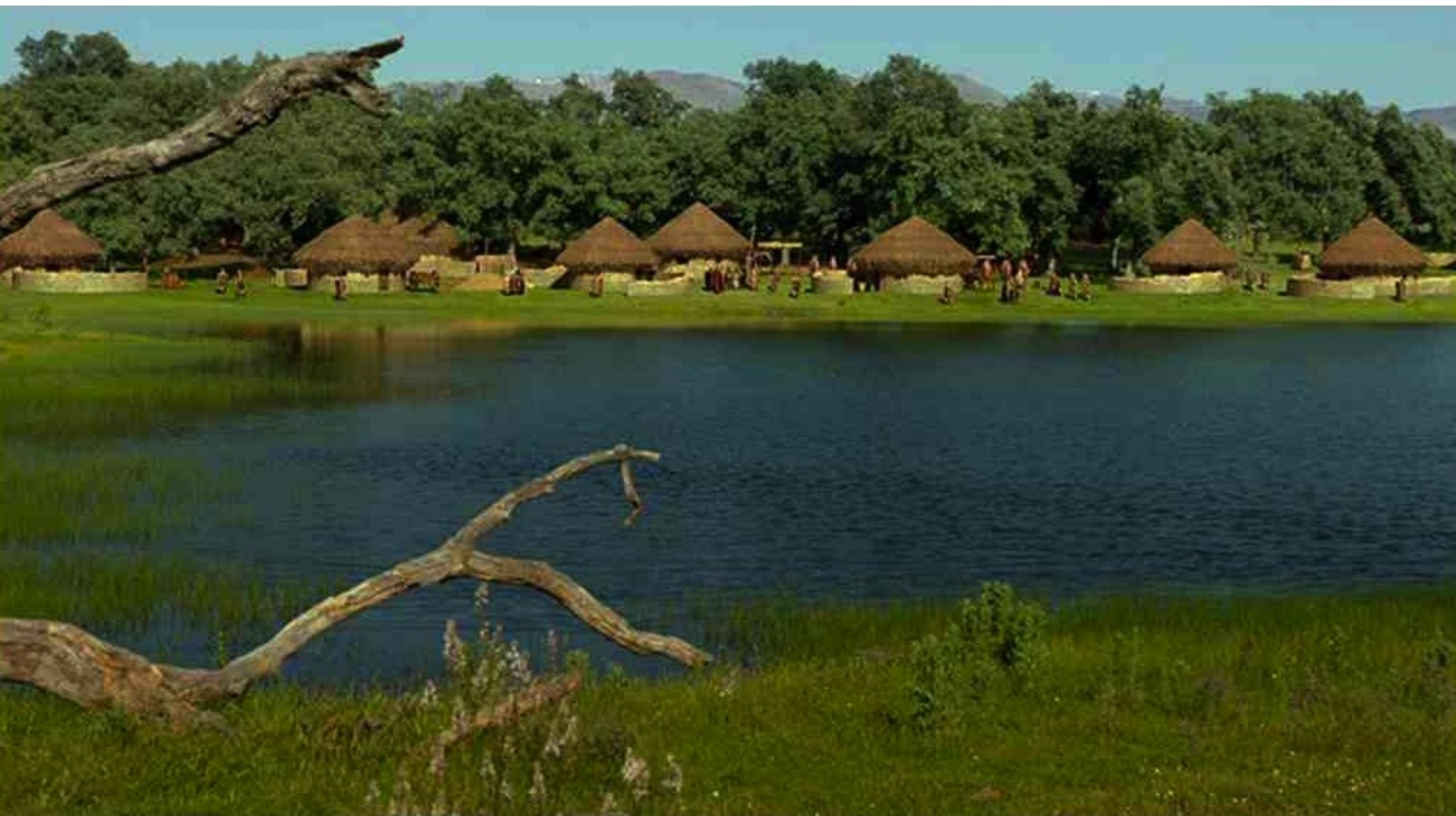
Hispania, la Leyenda : dans la capitale...