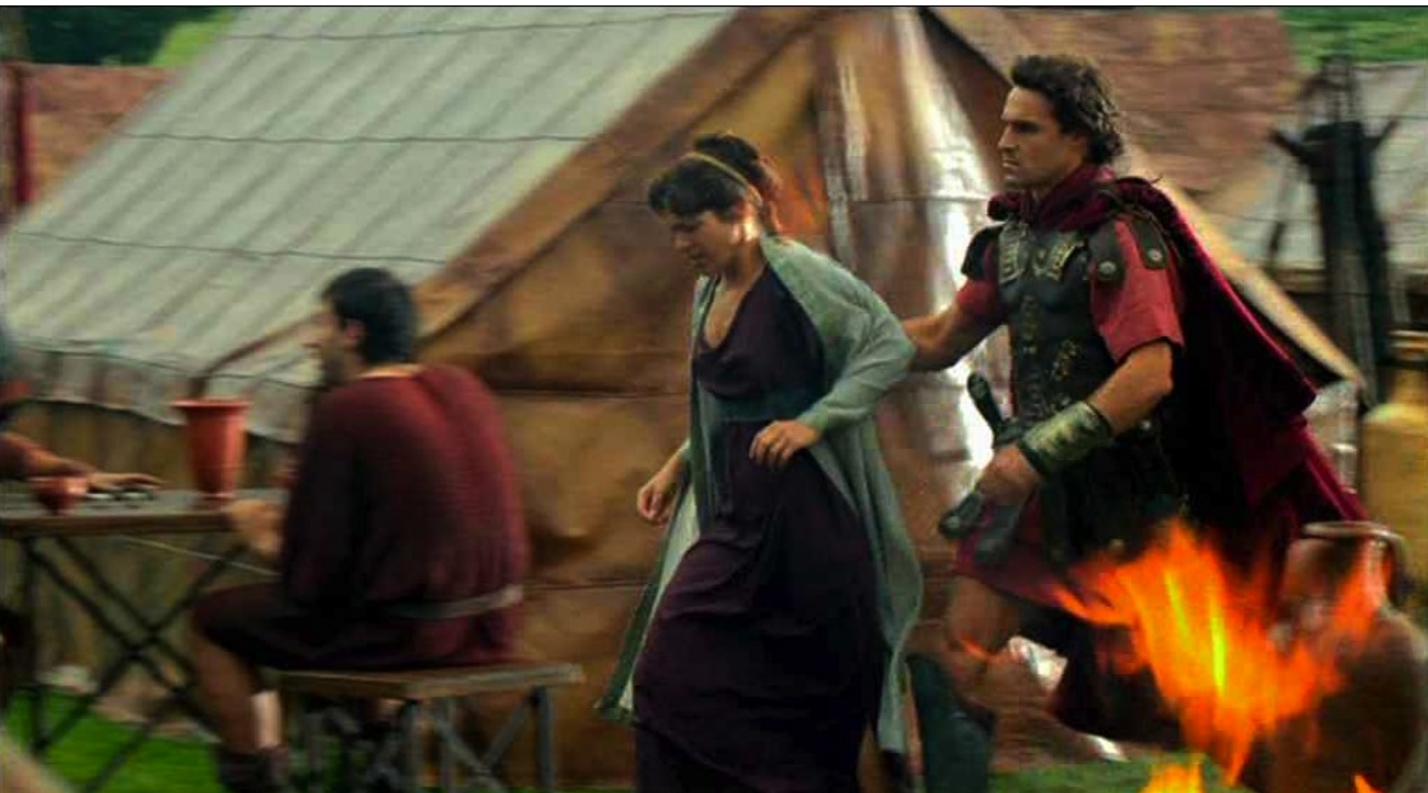
Hispania, la Leyenda : furieux, il la traîne à travers le camp...