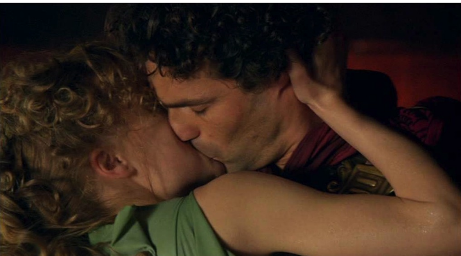
Hispania, la Leyenda : alors elle tombe dans les bras de son amant et l'embrasse avec passion.