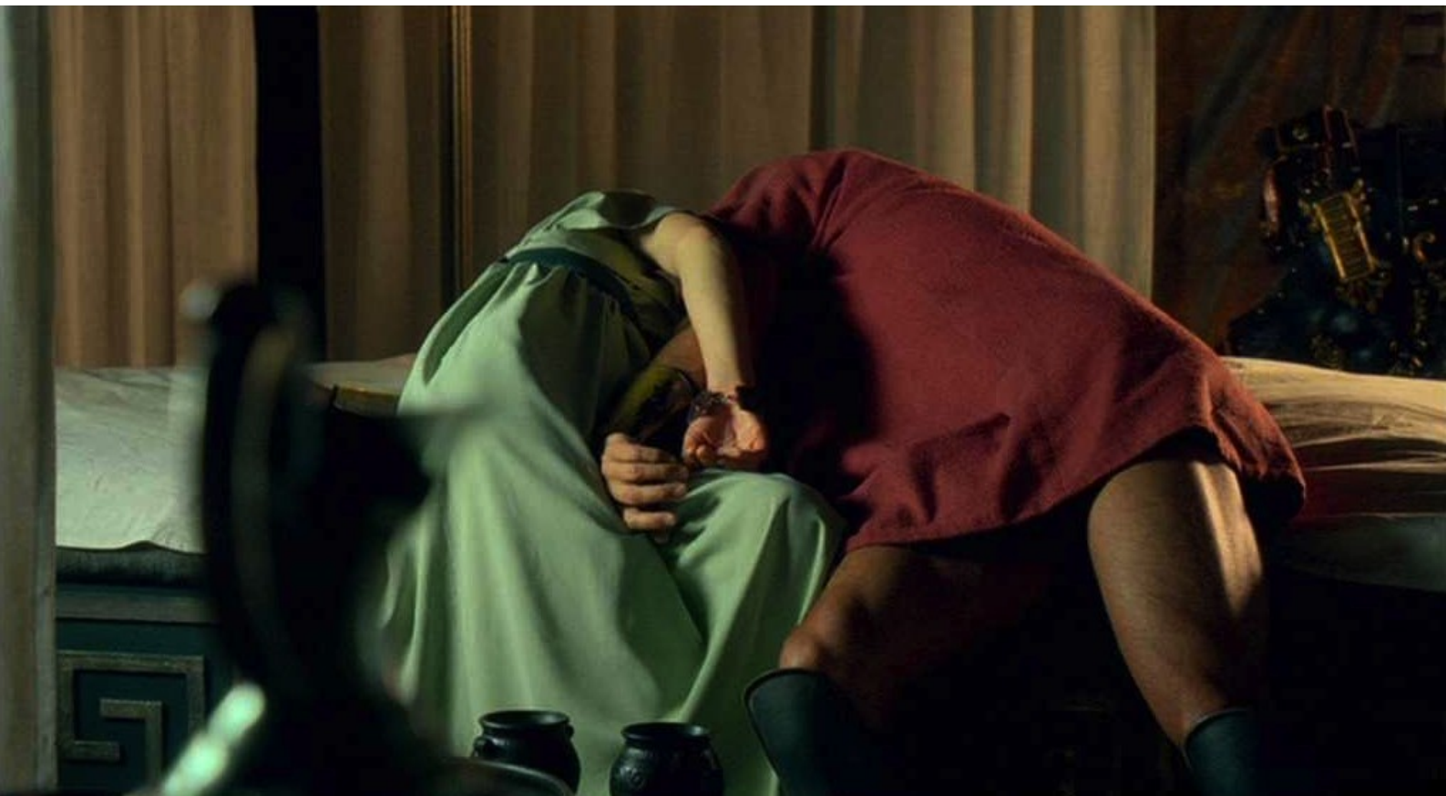
Hispania, la Leyenda : puis Sabina sombre à son tour dans le sommeil.