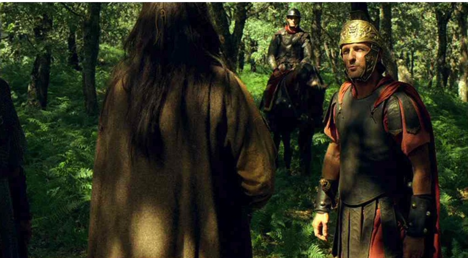
Hispania, la Leyenda : et lui demande de devenir son indicateur chez les rebelles :