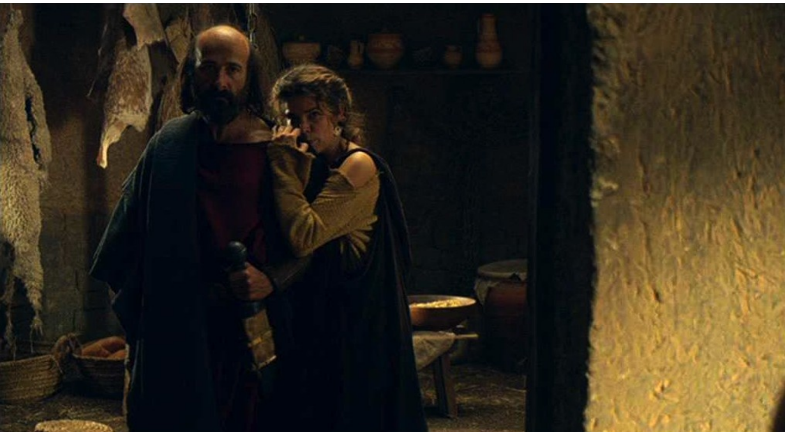
Hispania, la Leyenda : qui rassure son "épouse"...