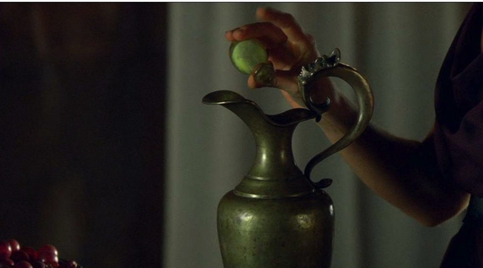
Hispania, la Leyenda : et de verser un somnifère dans sa boisson.