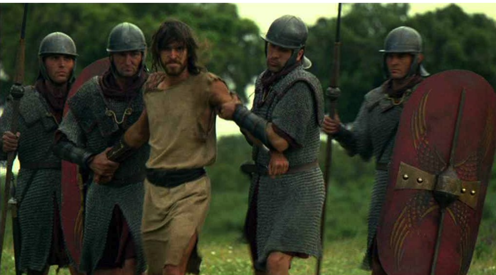
Hispania, la Leyenda : espérant ainsi les contaminer eux aussi.