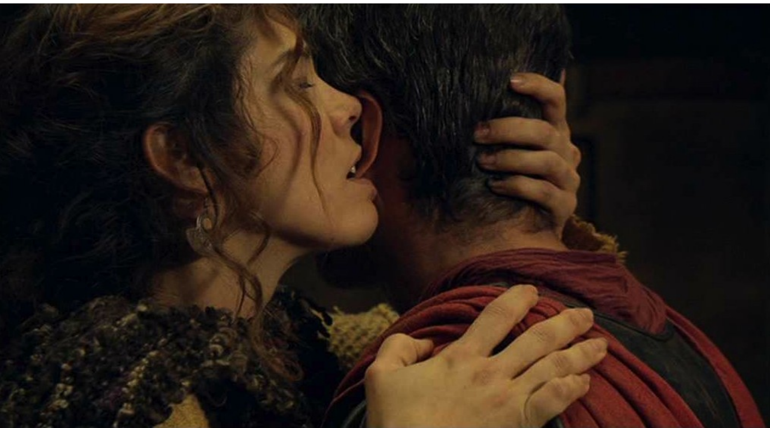
Hispania, la Leyenda : en lui mordillant l'oreille.