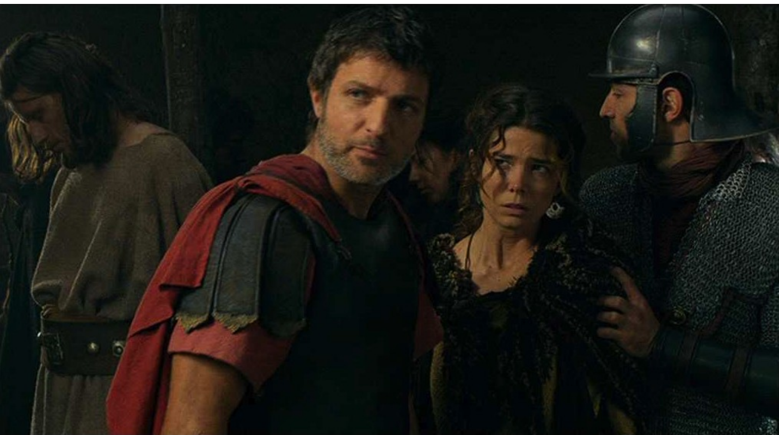
Hispania, la Leyenda : mais Marco accepte de la relâcher,