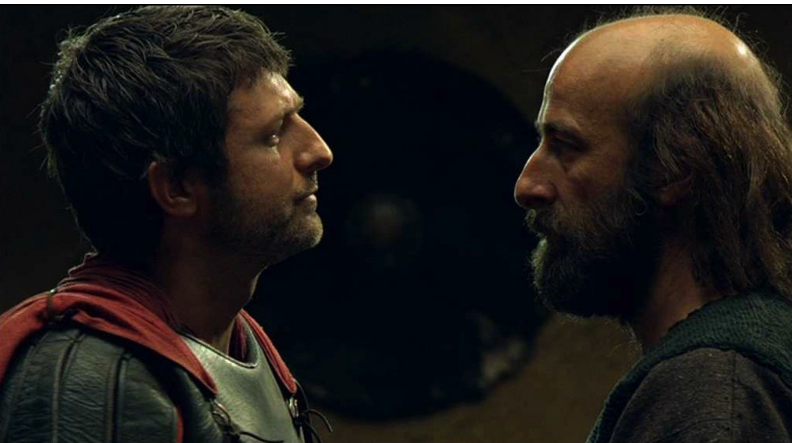
Hispania, la Leyenda : pour demander à Teodoro les renseignements utiles aux arrestations.