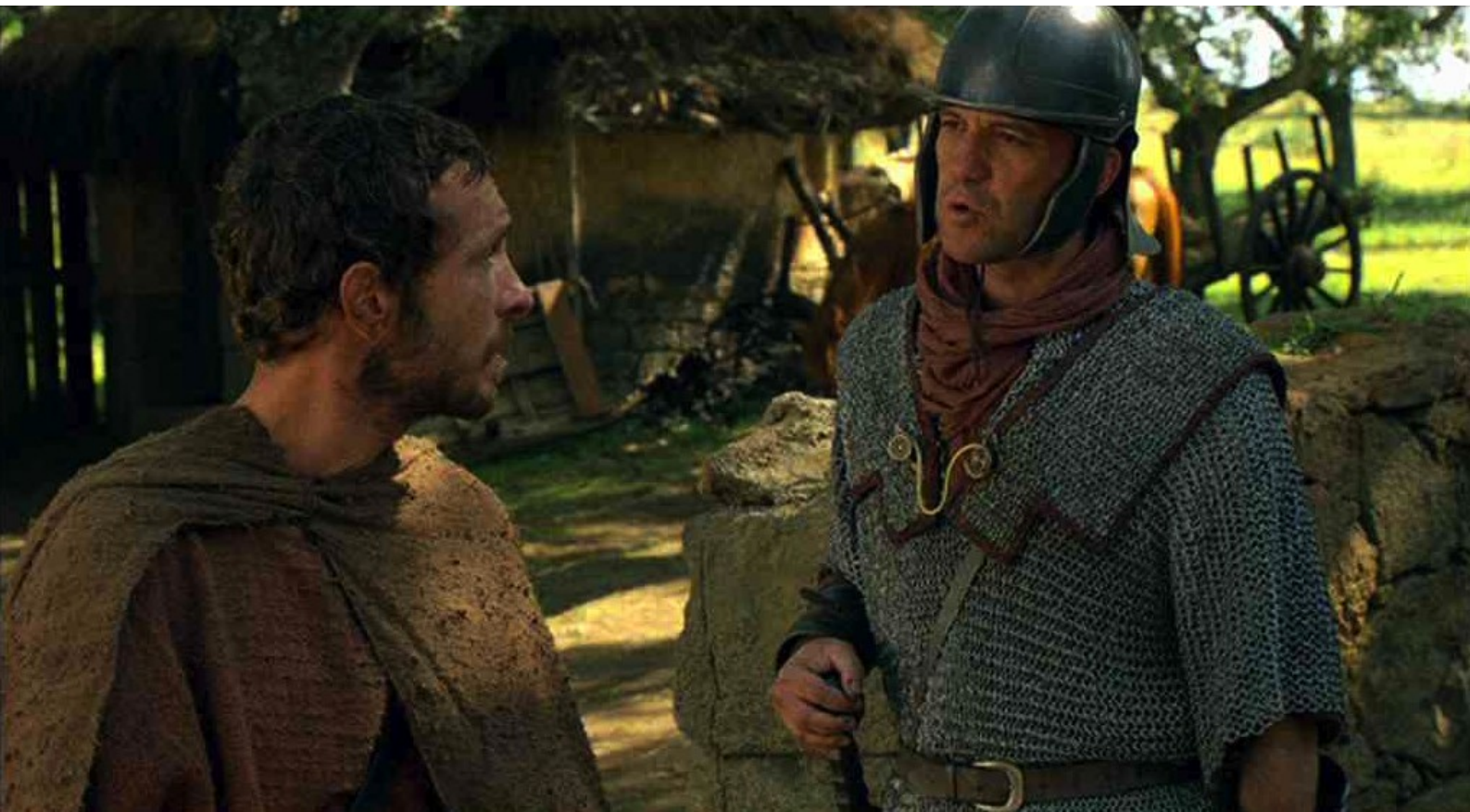
Hispania, la Leyenda : et discute avec des légionnaires.