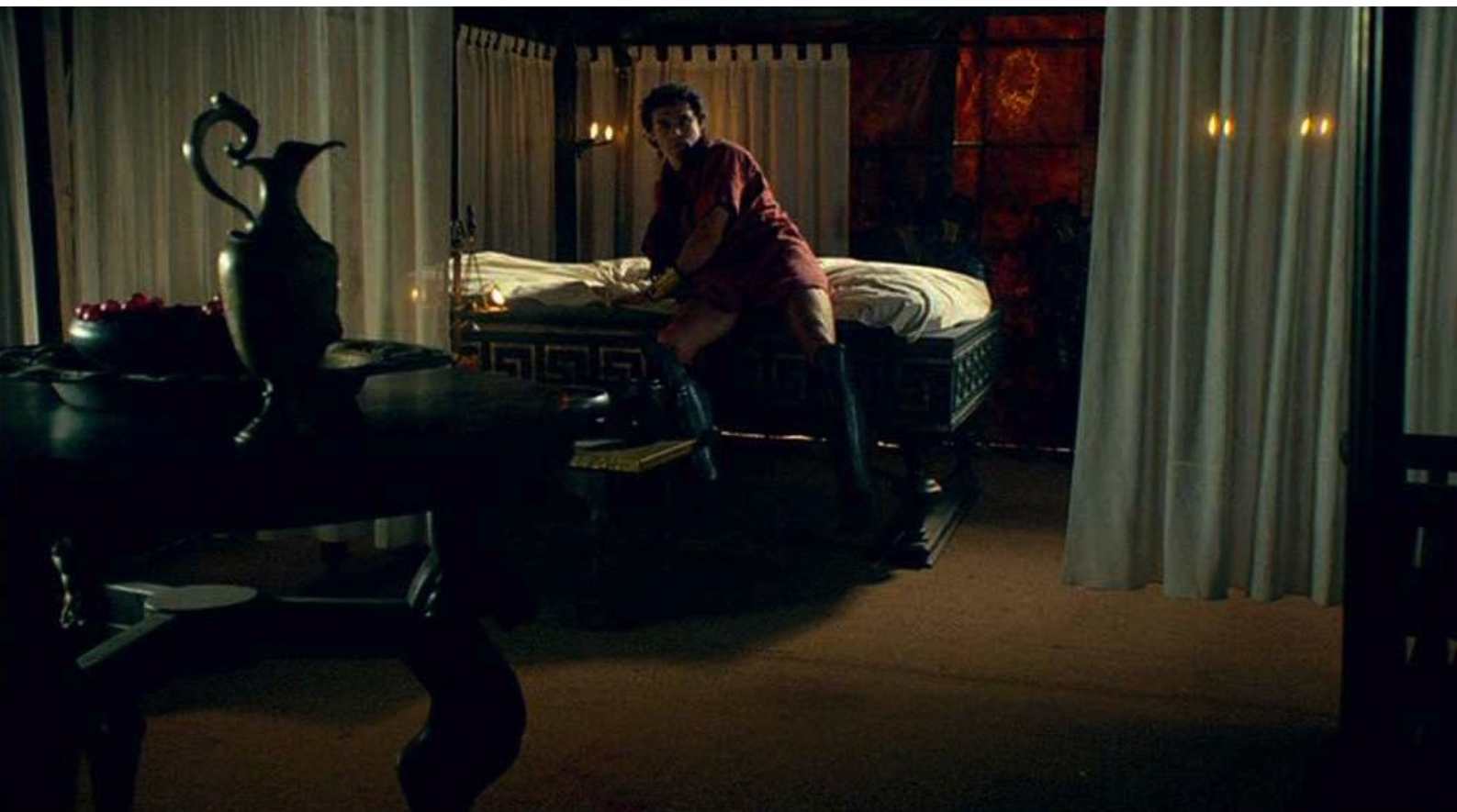
Hispania, la Leyenda : Lorsque Fabio se réveille péniblement,