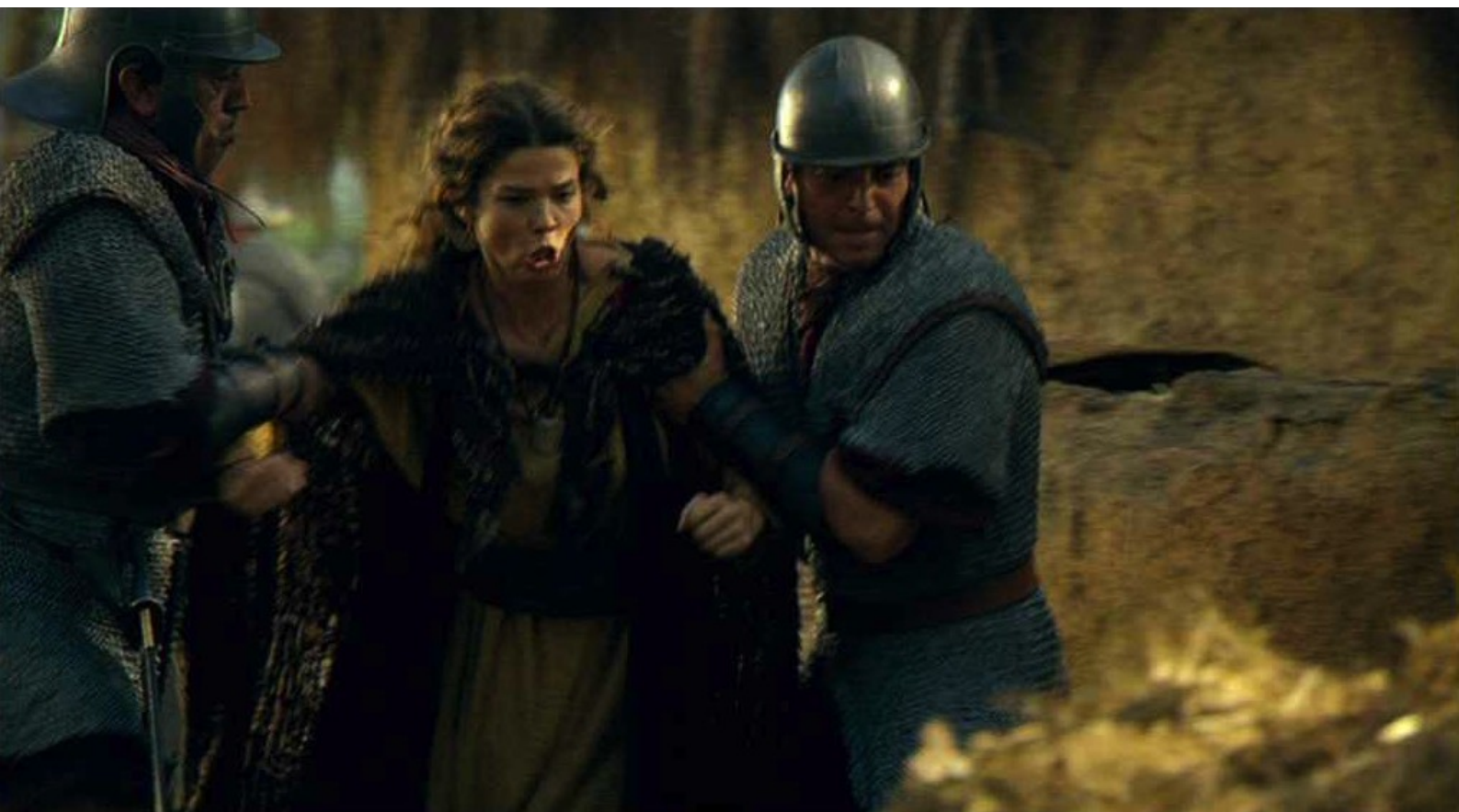
Hispania, la Leyenda : Peine perdue ! Il la fait emmener prisonnière.