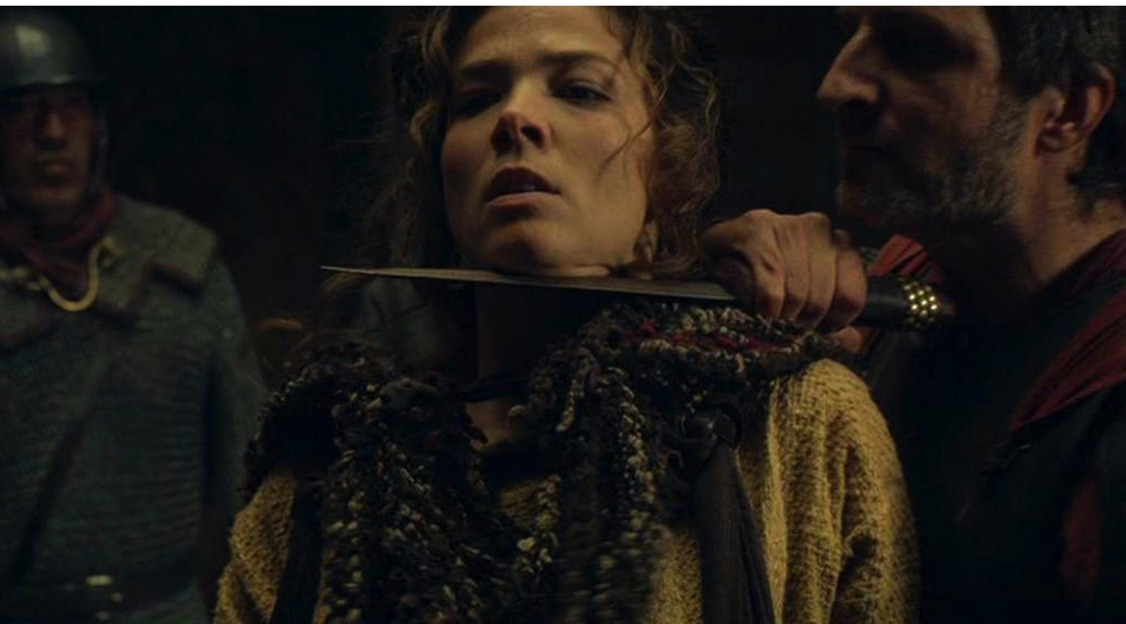
Hispania, la Leyenda : Puis, arrêtée par Marco,