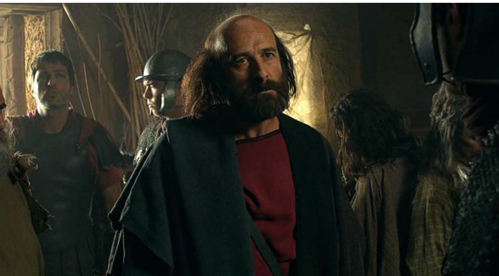
Hispania, la Leyenda : Pourtant Teodoro, prétendant qu'elle est sa femme, intervient pour la faire libérer...