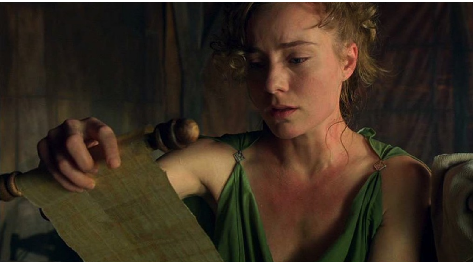
Hispania, la Leyenda : qu'elle lit avec étonnement ;