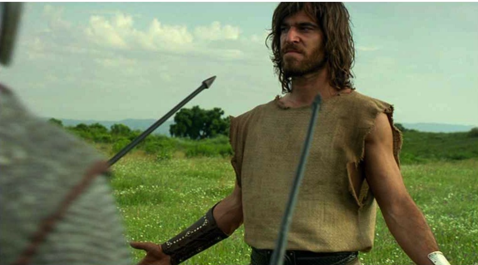
Hispania, la Leyenda : il se rend aux Romains,