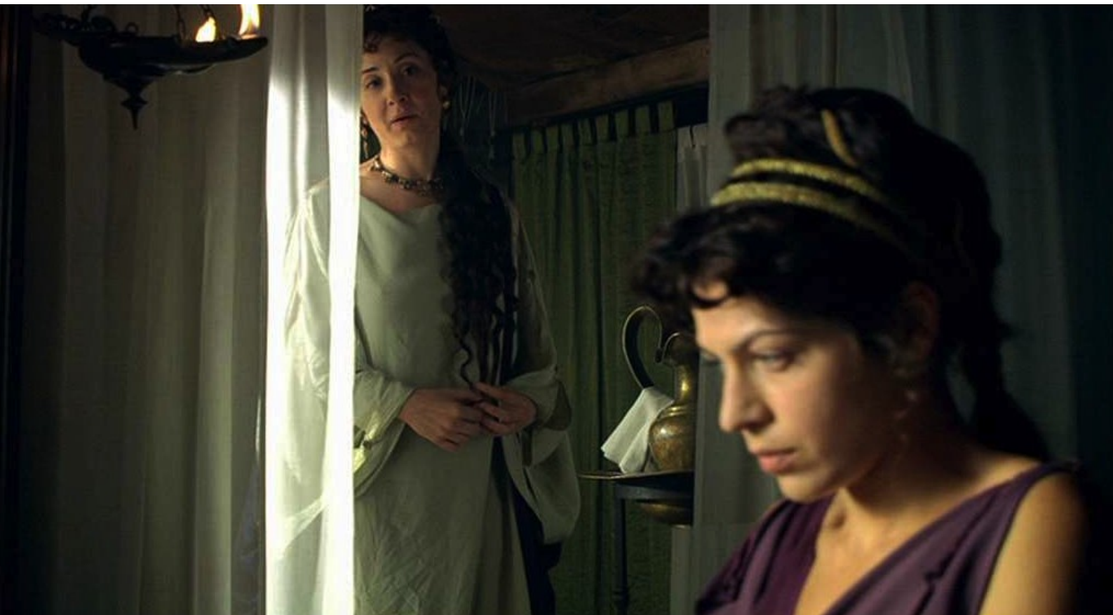
Hispania, la Leyenda : Pendant ce temps, Claudia demande à Gaia...