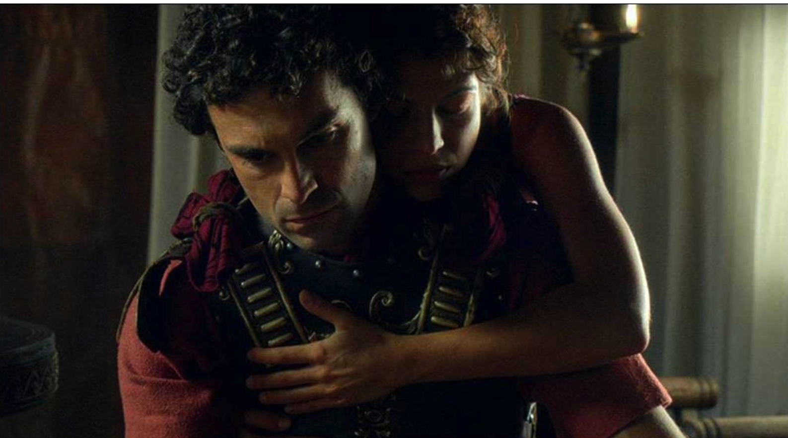
Hispania, la Leyenda : et elle cherche à le séduire.