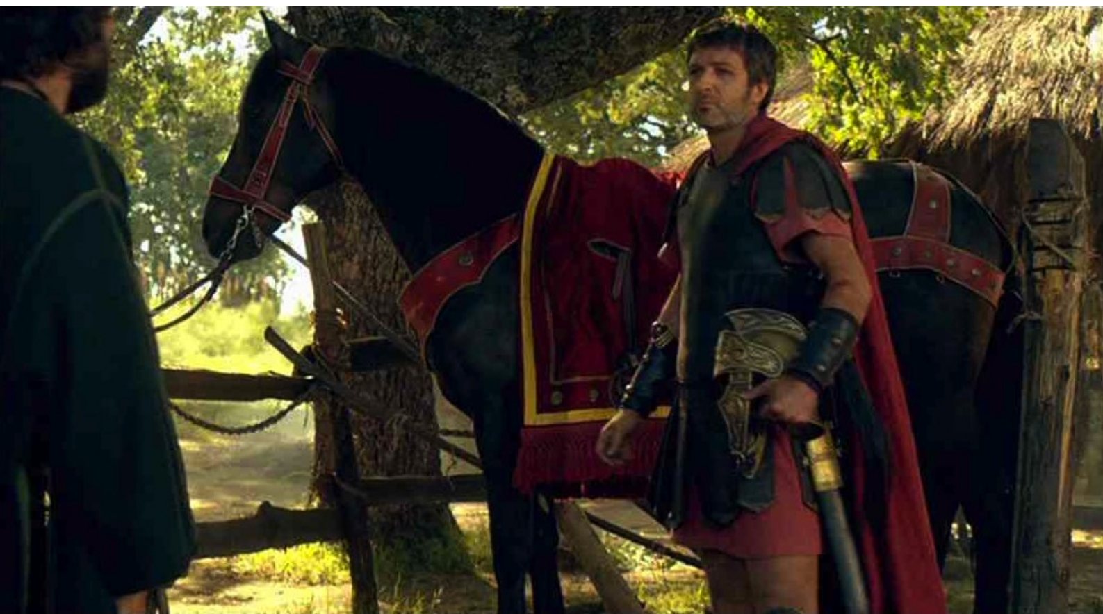
Hispania, la Leyenda : et, afin d'exécuter les parents des rebelles, il envoie Marco...