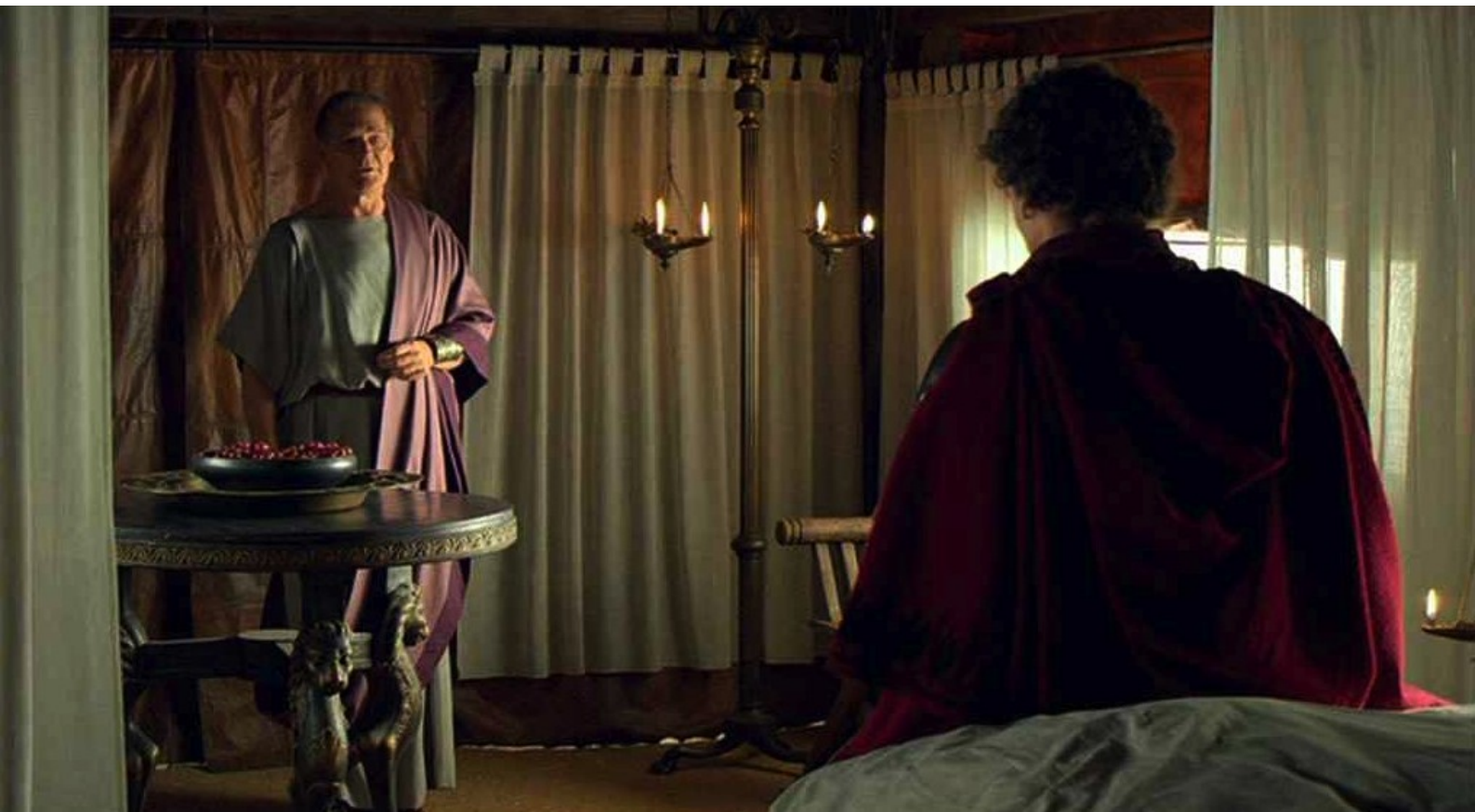
Hispania, la Leyenda : tandis que Galba demande à son fils de lui obéir désormais aveuglément.