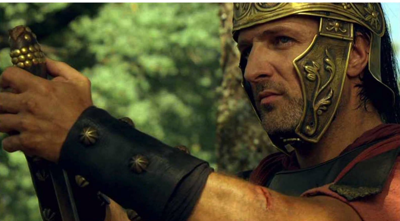
Hispania, la Leyenda : De son côté, Marco a finalement arrêté Navia ;