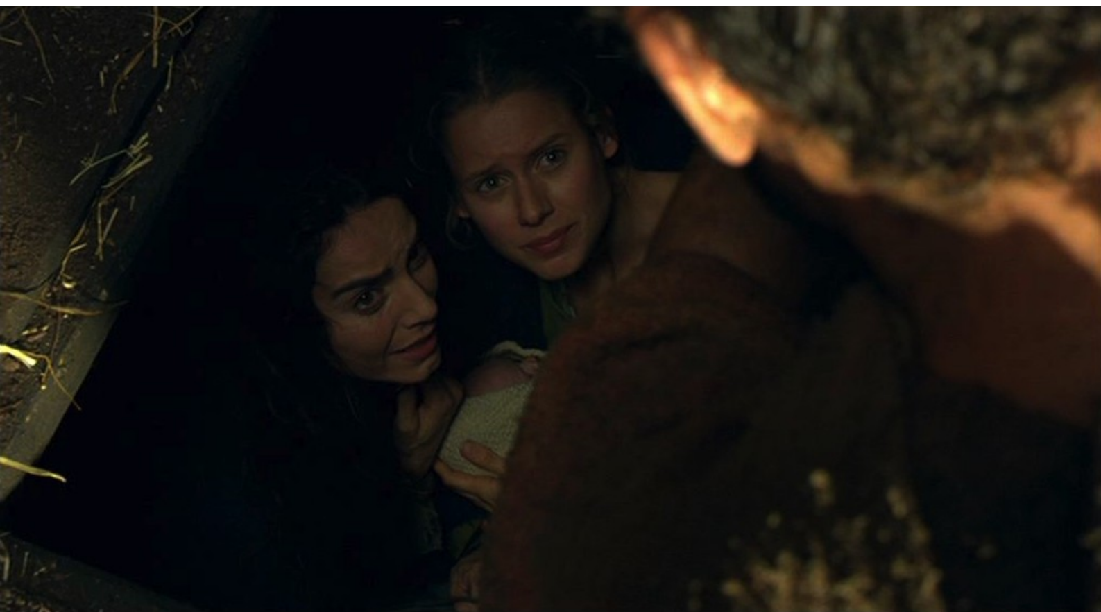
Hispania, la Leyenda : découvre Navia et Helena cachées...