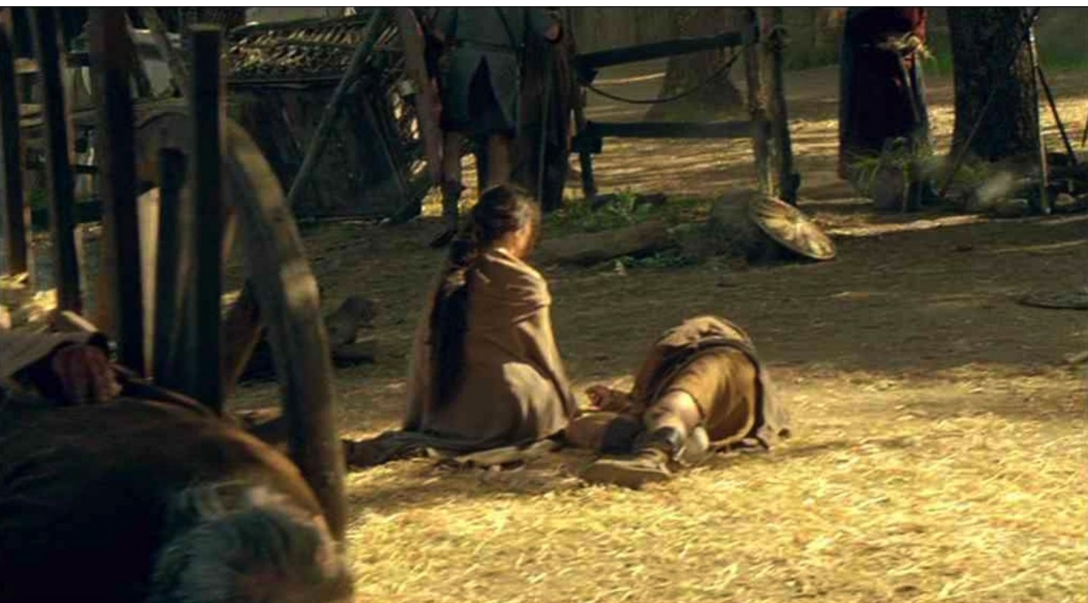
Hispania, la Leyenda : À Caura, après le massacre, on ramasse les cadavres.

Comme portfolios du numéro 46 de La 12 e Heure , nous vous offrons plusieurs florilèges de photos tirées des épisodes de la série Hispania, la Leyenda , à laquelle nous avons consacré presque tout le numéro 46 de notre fanzine (captures d'écran de Claude Aubert).