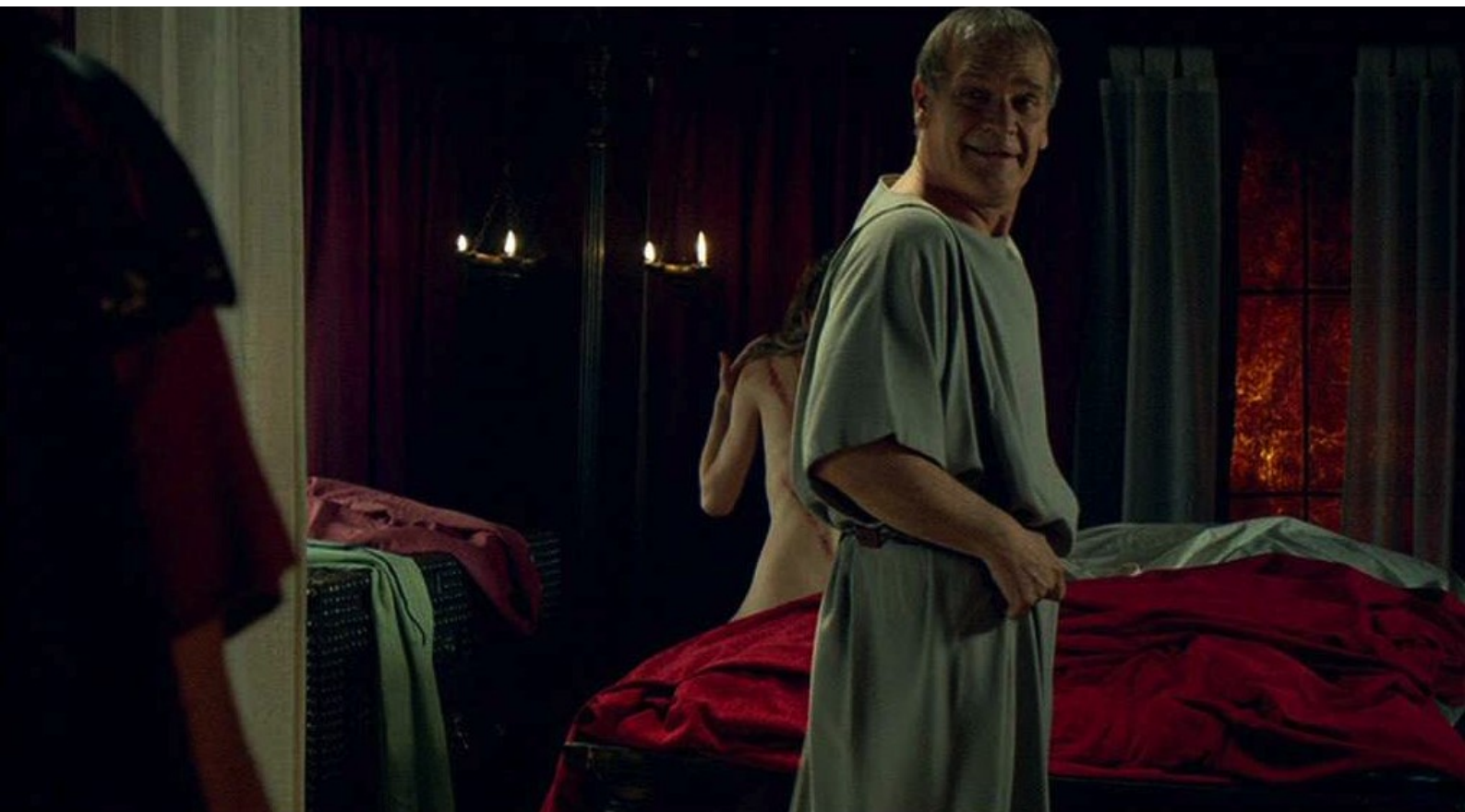
Hispania, la Leyenda : et, pour l'humilier, montre le résultat à son fils ;