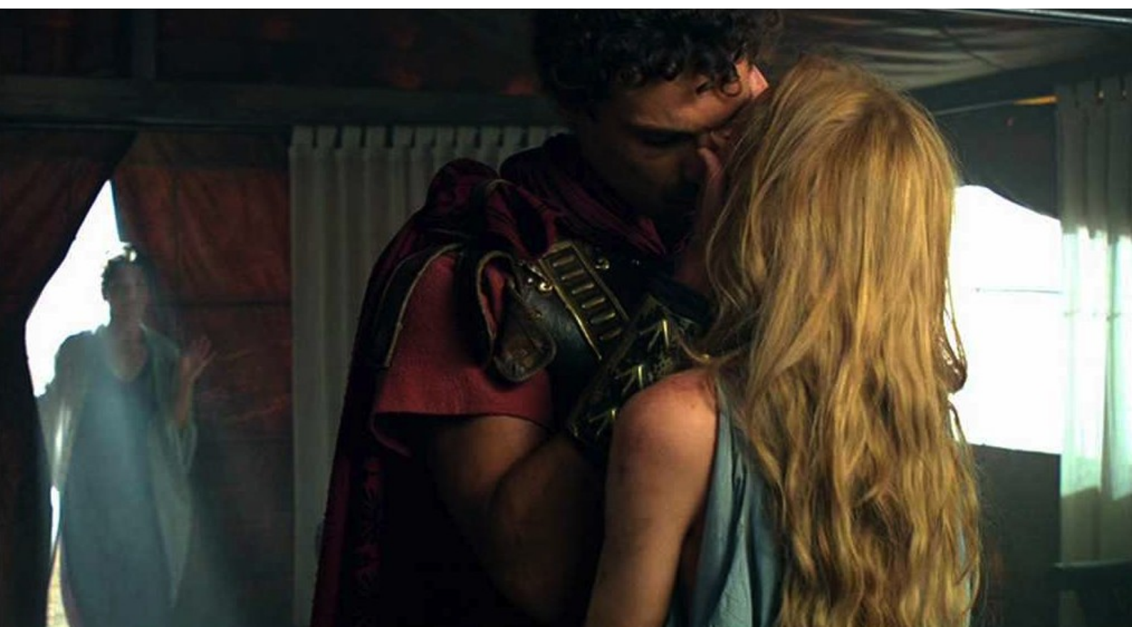
Hispania, la Leyenda : Au camp, la jalouse Gaia surprend Fabio embrassant Sabina ;