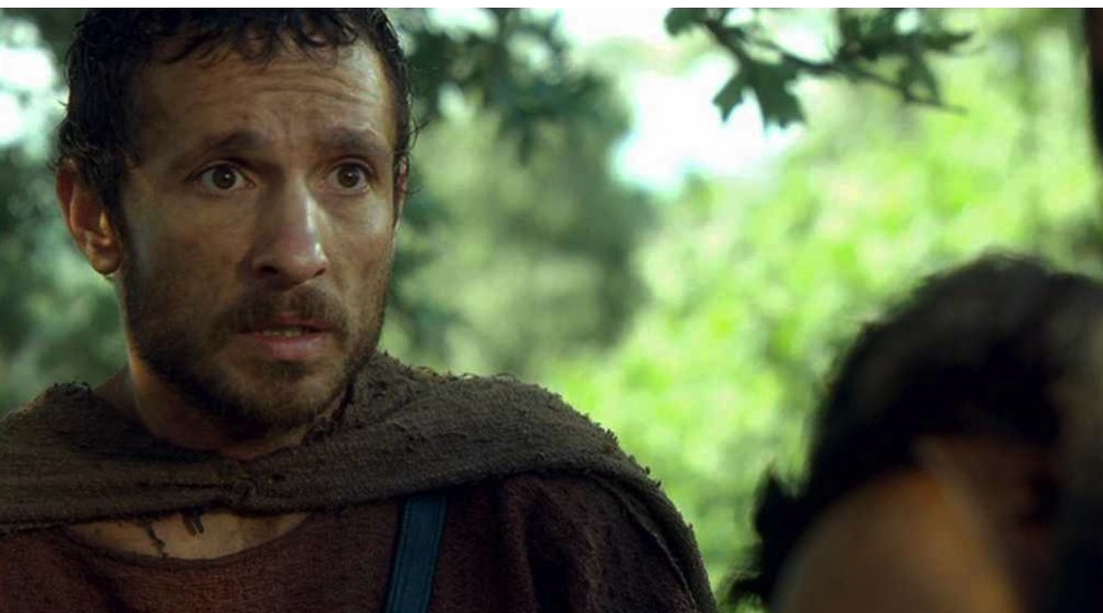
Hispania, la Leyenda : mais Hector, toujours auxiliaire chez les Romains,