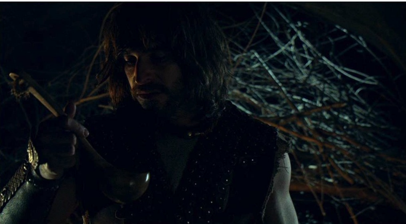
Hispania, la Leyenda : Alors, il boit à même une coupe infectée...