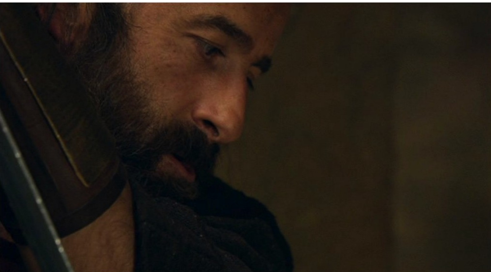
Hispania, la Leyenda : et menace Alejo,