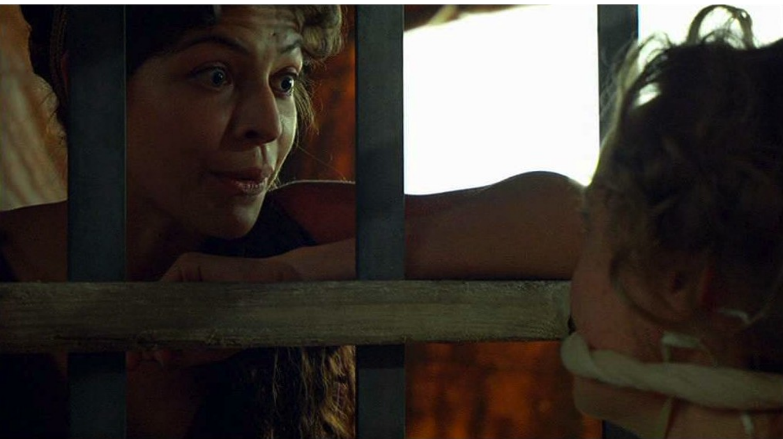
Hispania, la Leyenda : et sa rivale vient se moquer d'elle,