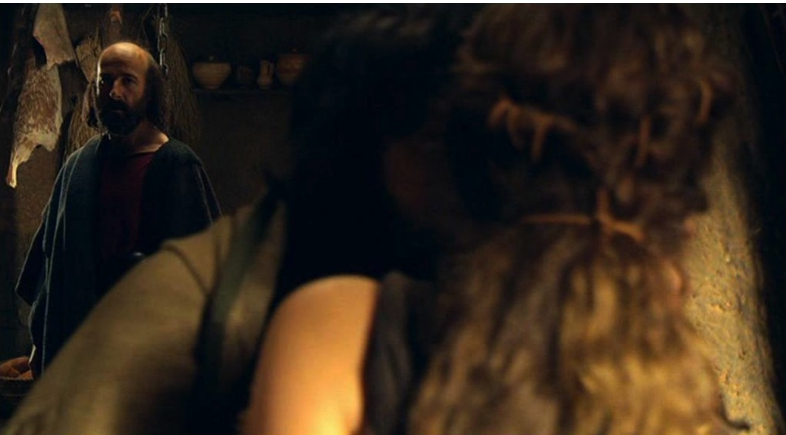
Hispania, la Leyenda : mais il est surpris par Teodoro,