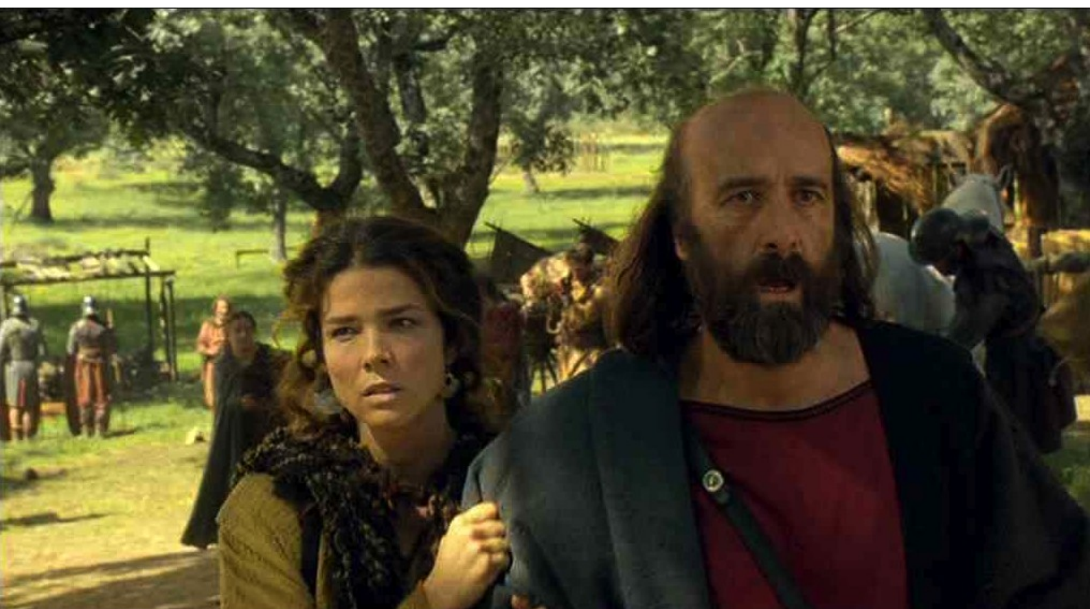
Hispania, la Leyenda : qui l'emmène chez lui...