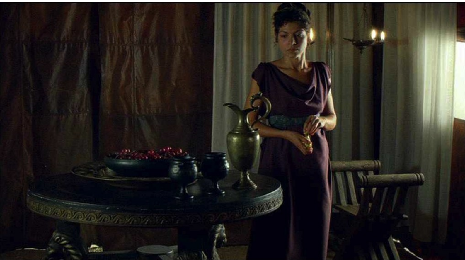
Hispania, la Leyenda : d'aller dans la tente de Fabio...