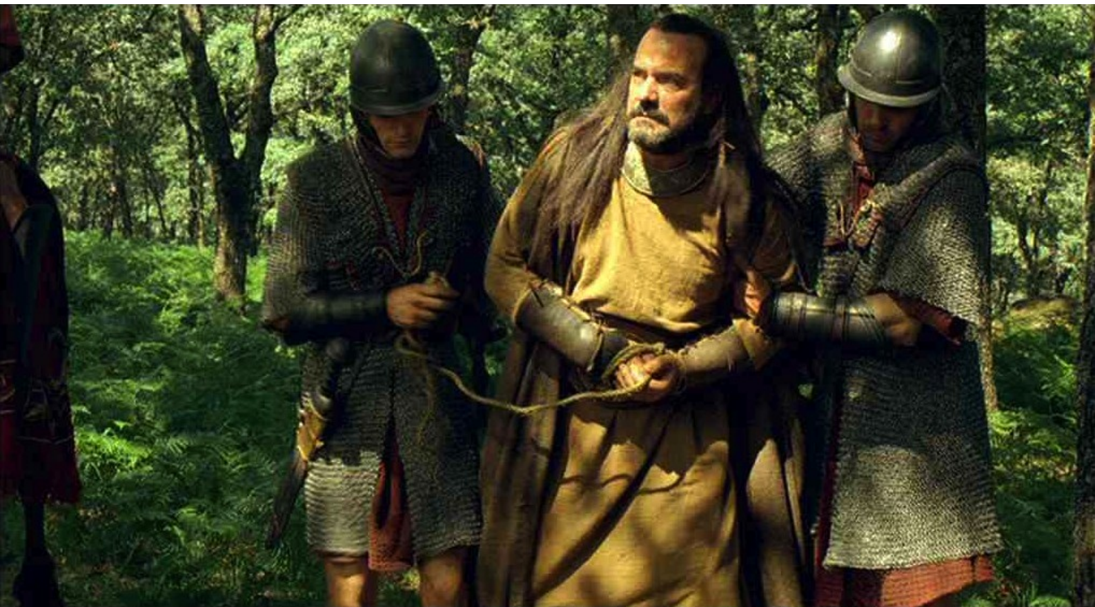
Hispania, la Leyenda : il fait emmener son père Baltar dans la forêt...