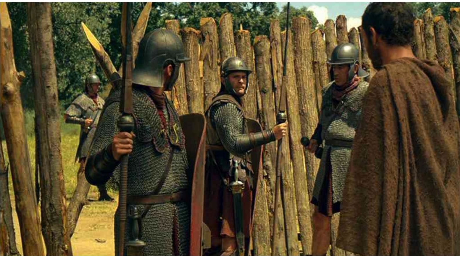
Hispania, la Leyenda : après avoir réussi à pénétrer dans la ville,