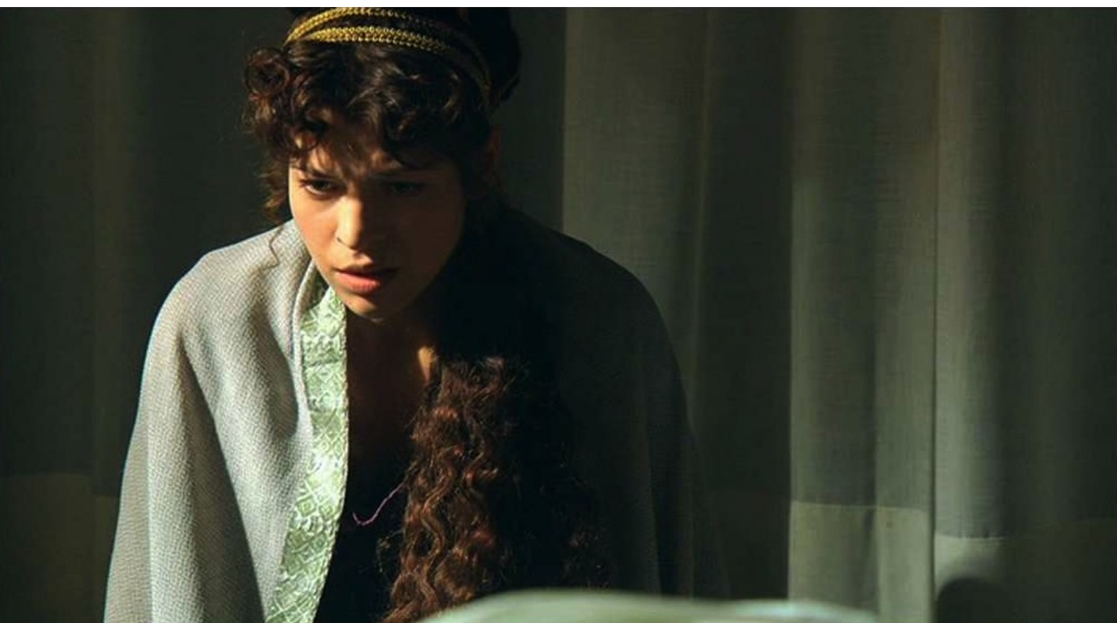
Hispania, la Leyenda : et va la donner...