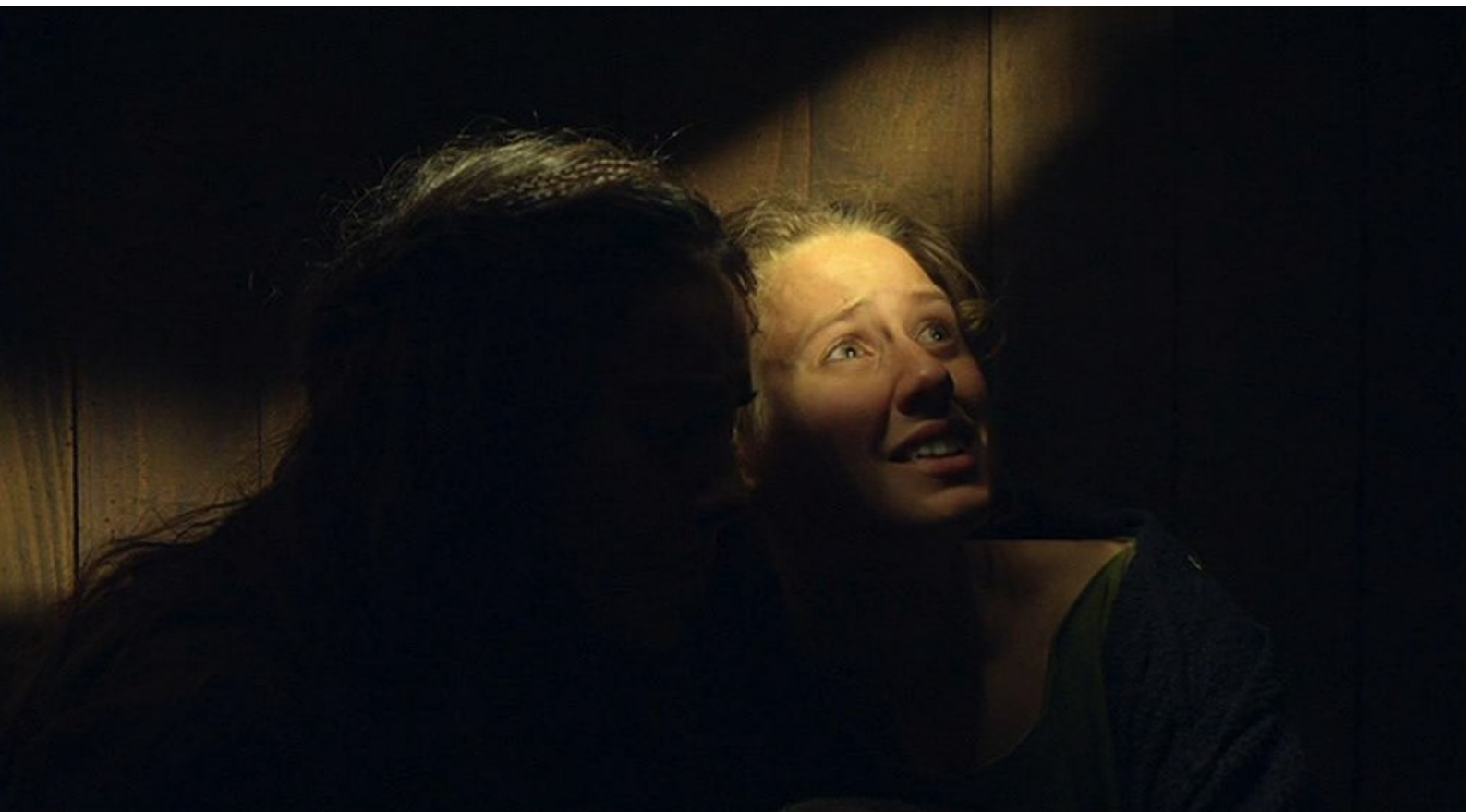
Hispania, la Leyenda : et prétend aux autres légionnaires qu'il n'a trouvé personne.