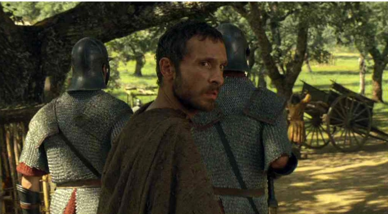
Hispania, la Leyenda : sous les yeux étonnés d'Hector...