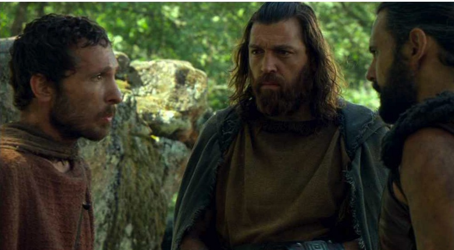
Hispania, la Leyenda : il fait venir ses amis rebelles et discute avec eux ;