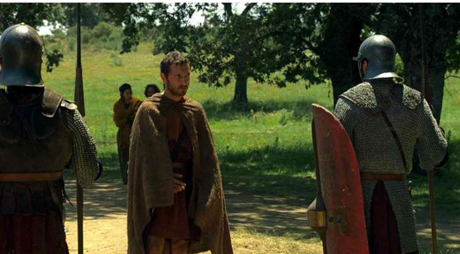
Hispania, la Leyenda : mais d'autre part il se mêle aux sentinelles romaines...