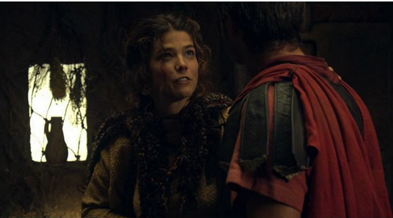
Hispania, la Leyenda : Aldara, la "sœur" de Paulo, essaie de le séduire