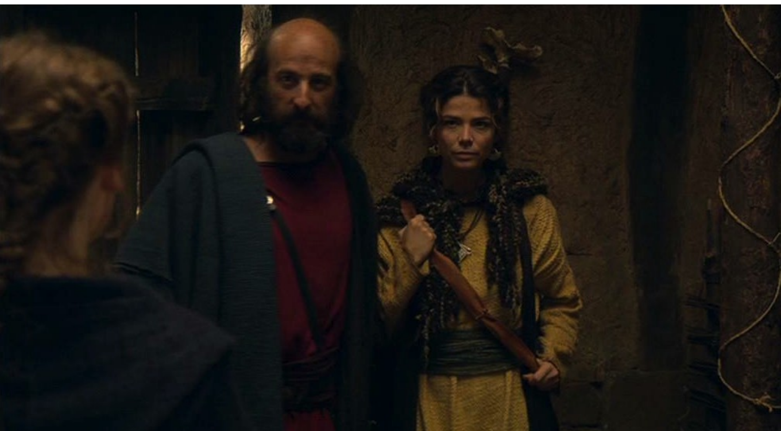
Hispania, la Leyenda : et il annonce à sa fille qu'il a pris la jeune femme comme épouse.