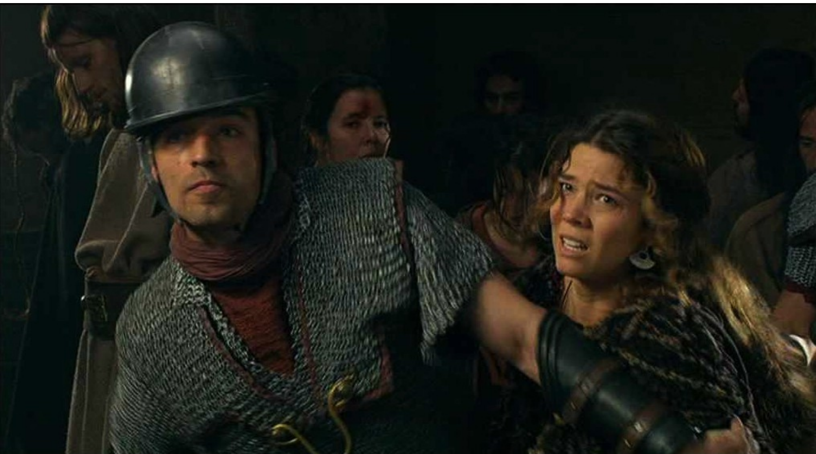
Hispania, la Leyenda : bien qu'elle soit retenue par un légionnaire,