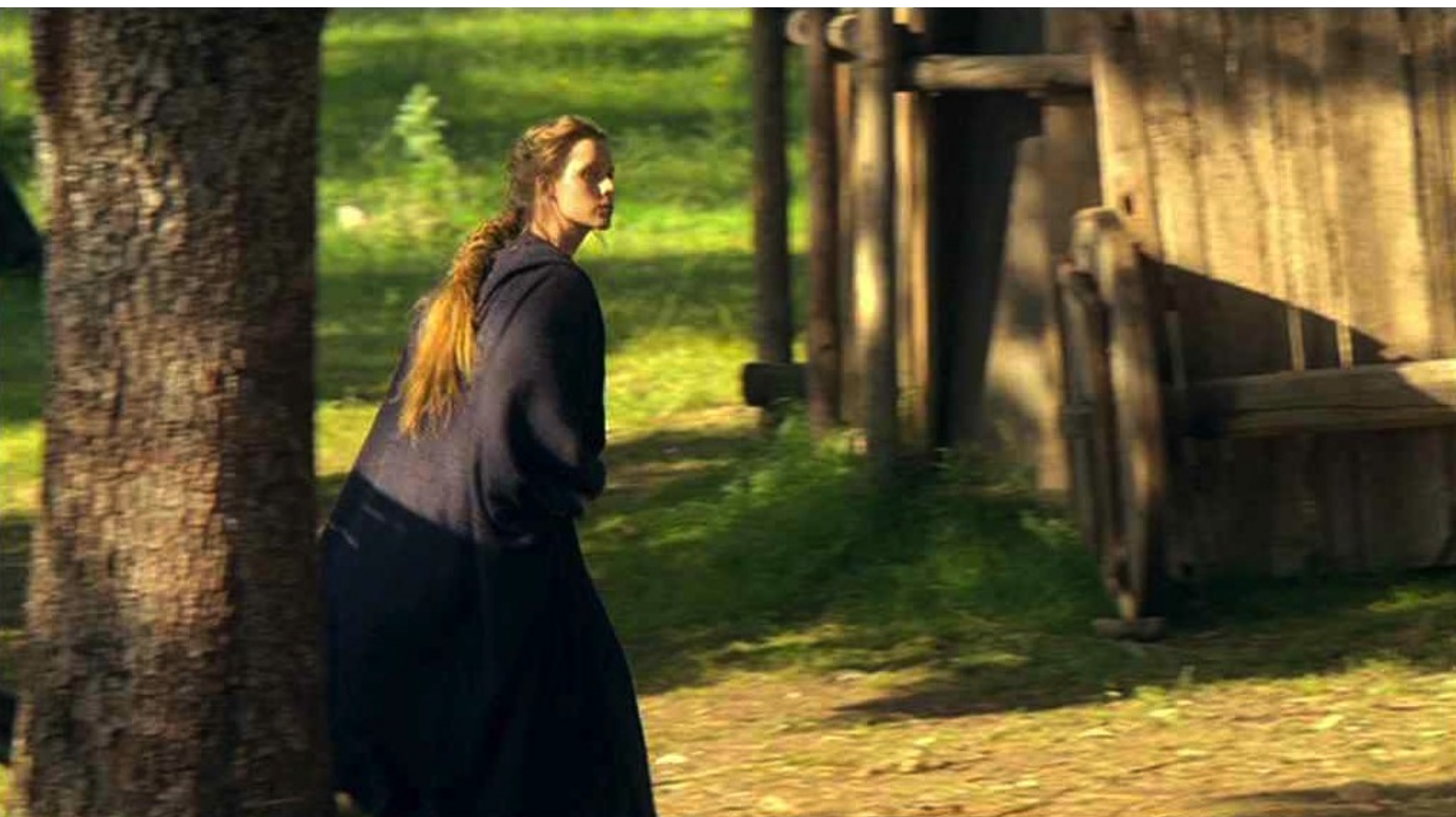
Hispania, la Leyenda : Alors, Helena court avertir Navia, l'épouse de Dario, de se cacher,