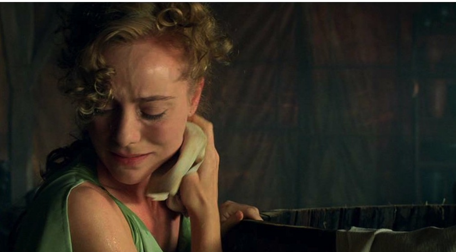
Hispania, la Leyenda : Mais elle, se sentant salie, cherche à se purifier en se lavant,