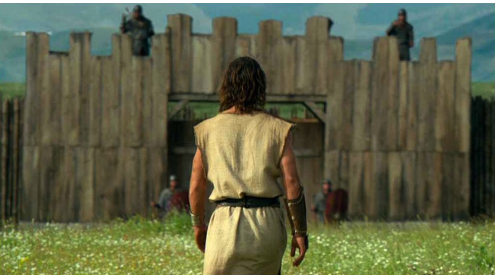
Hispania, la Leyenda : et, se pensant malade,