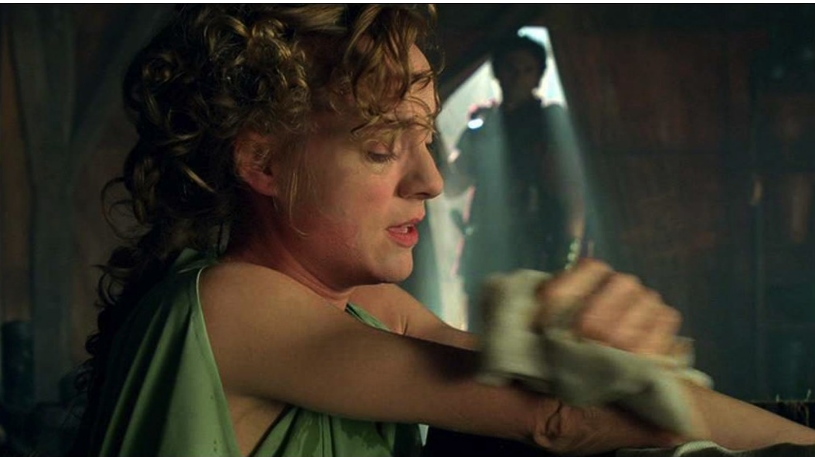
Hispania, la Leyenda : quand soudain Fabio entre dans la tente...