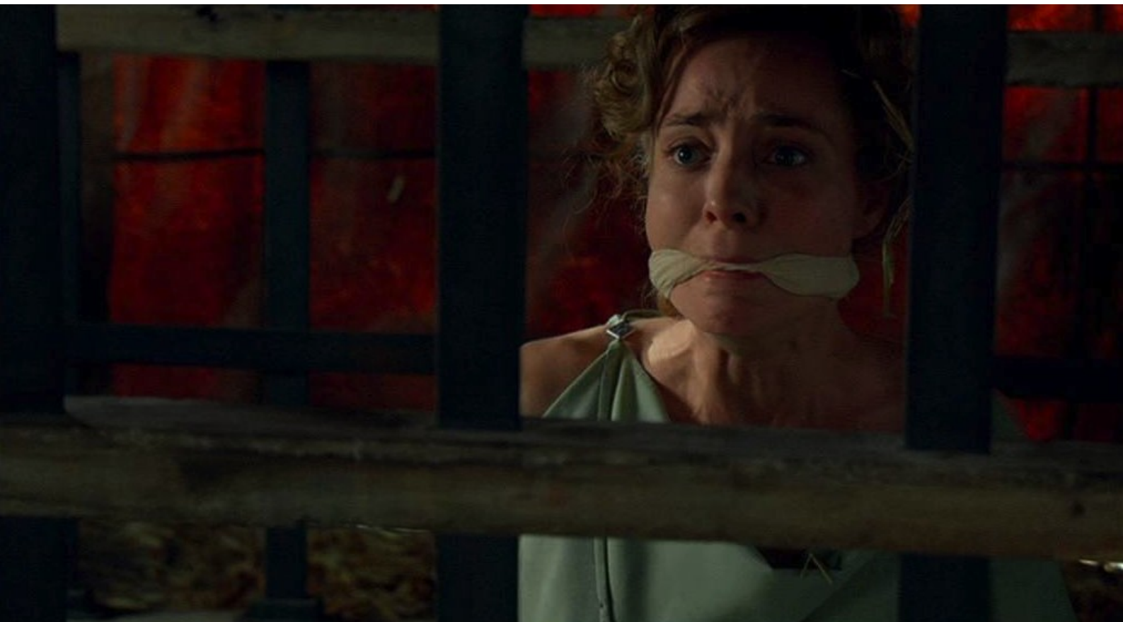
Hispania, la Leyenda : En réalité, Sabina est dans le camp, bâillonnée et enfermée dans une cage,