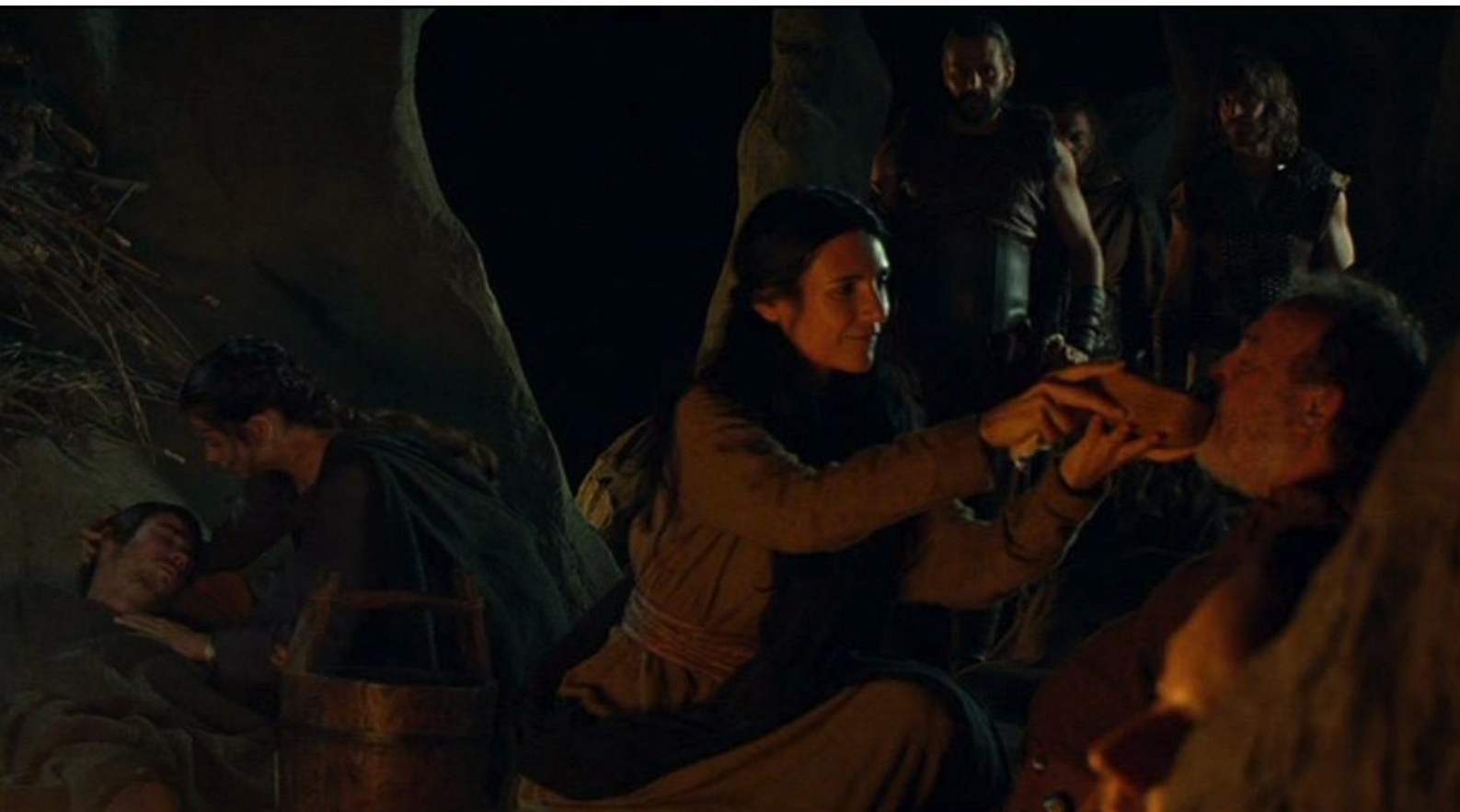
Hispania, la Leyenda : de l'épidémie qui frappe les siens,