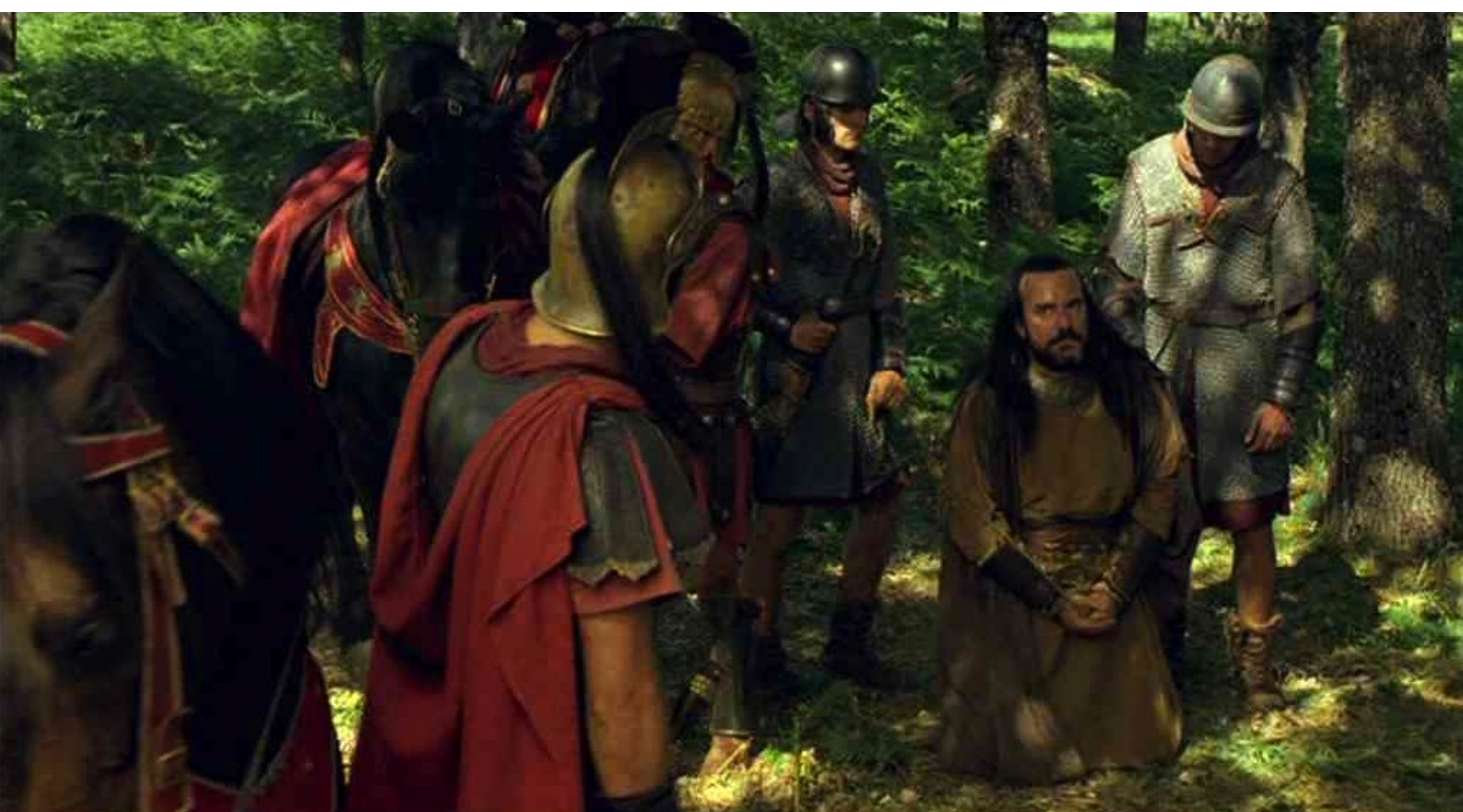
Hispania, la Leyenda : sinon, il le tuera, lui ainsi que sa fille.